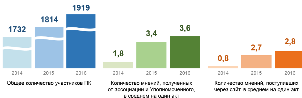
Рисунок 2. Динамика количества участников публичных консультаций и мнений, полученных по их результатам, в 2014-2016 гг.

За 2016 год активность участия в ПК субъектов предпринимательской и инвестиционной деятельности, представителей предпринимательских объединений и общественных организаций осталась на таком же высоком уровне, что и в предыдущие годы. Среднее количество субъектов предпринимательства, участвовавших в обсуждении одного акта (проекта акта), составило 169, от представителей