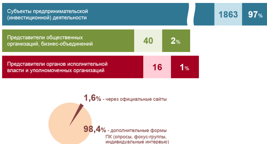
Рисунок 1. Общее количество и структура участников публичных консультаций по основным группам в 2016 году

Во многих случаях участниками ПК были как субъекты, деятельность которых непосредственно регулируется оцениваемым актом (например, предприятия, имеющие лицензию на осуществление медицинской деятельности, деятельности по обороту наркотических средств, психотропных веществ и их прекурсоров, культивированию наркосодержащих растений в городе Москве), так и субъекты, потенциально подпадающие под регулирование (например, инвесторы, застройщики – потенциальные участники аукционов на право заключение договоров аренды земельного участка).